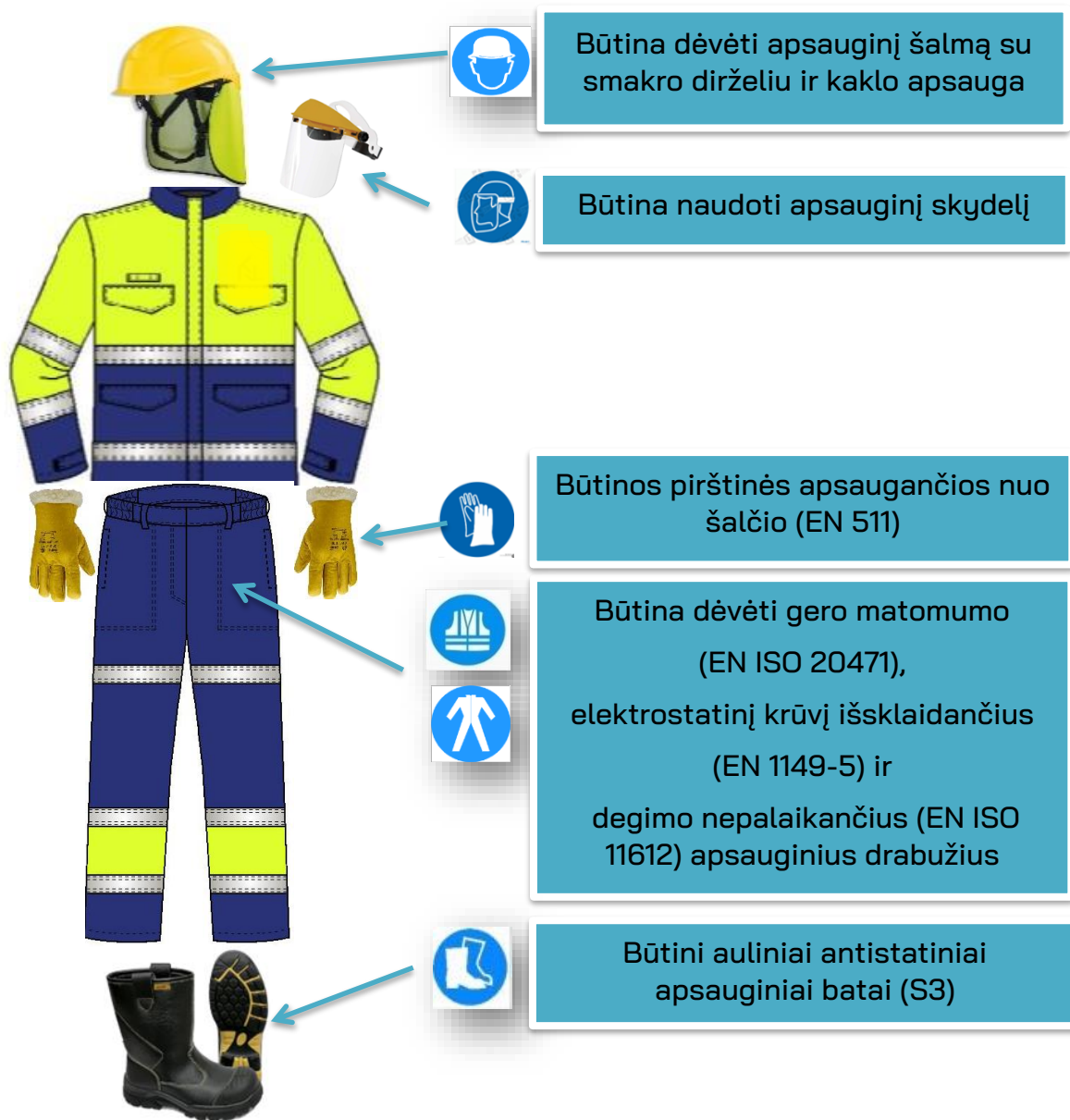
4 pav. Būtinos AAP SGD krovos metu, patenkant į KN technologinius objektus (įskaitant patekimo į potencialiai sprogia aplinką)

5.7. SGD (suskystintas gamtines dujas) vežantiems ir krovos operacijoje dalyvaujantiems vairuotojams bei KN darbuotojams būtinos AAP (4 pav.):