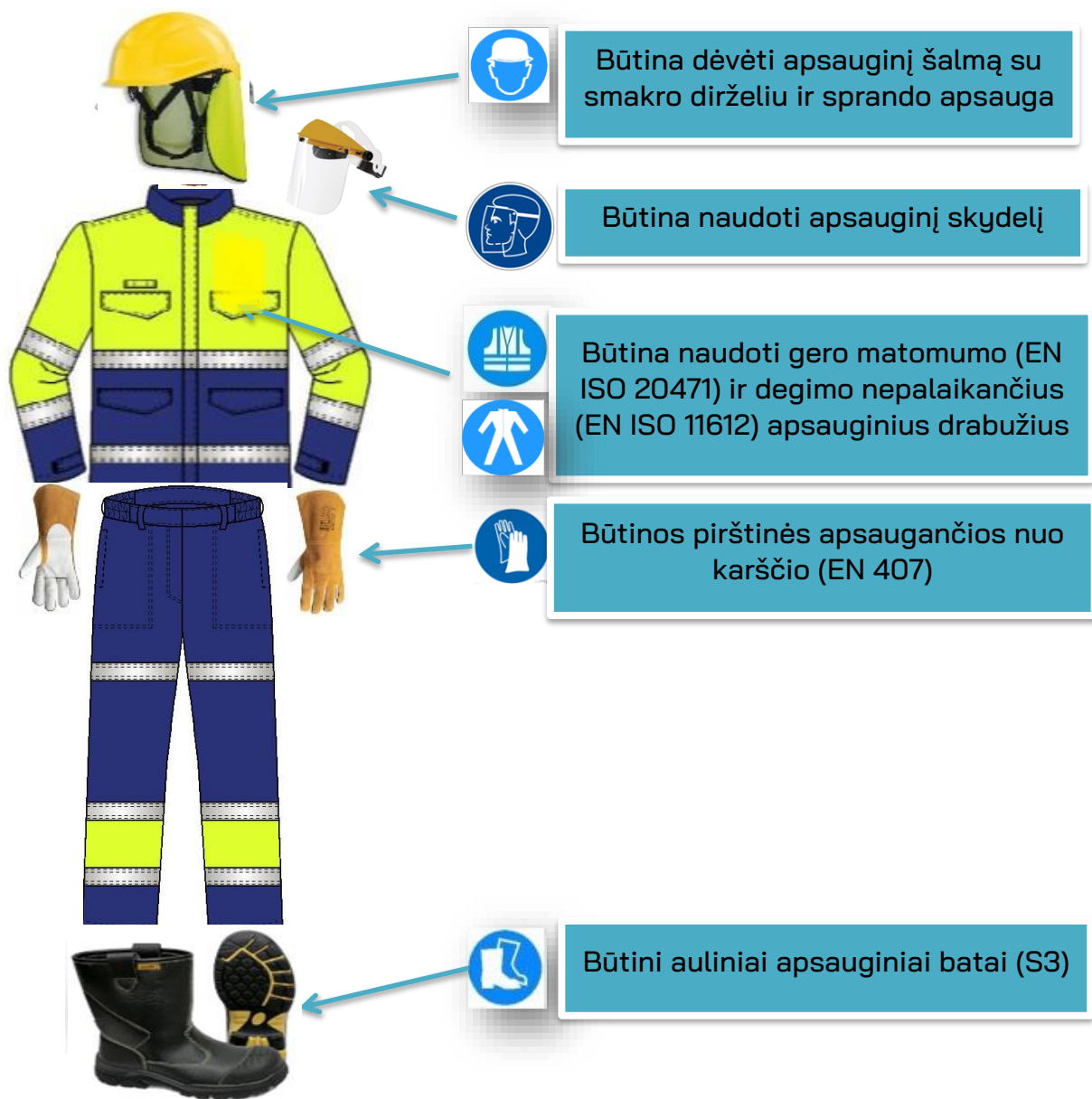
3 pav. Būtinos AAP bitumo krovos metu, patenkant į KN technologinius objektus ( neįskaitant patekimo į potencialiai sprogia aplinką )

5.6. Bitumą vežantiems ir krovos operacijoje dalyvaujantiems vairuotojams bei KN darbuotojams būtinos AAP (3 pav.):