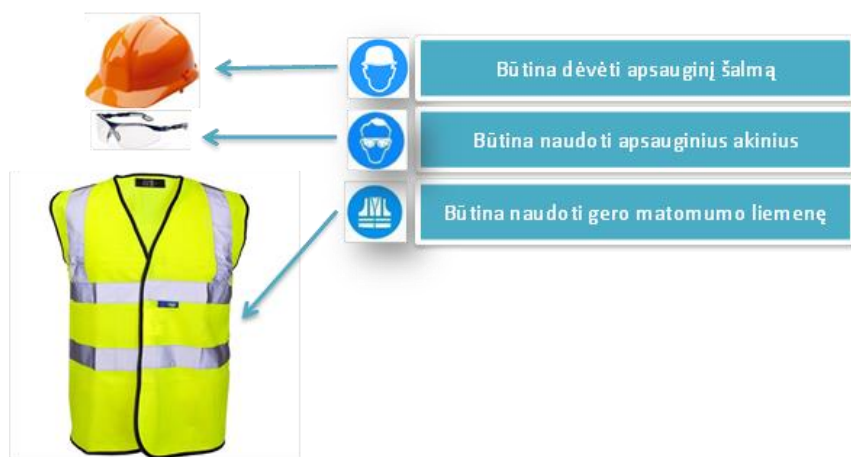
1 pav. Būtinios AAP patenkant į KN objektų teritorijas (netaikoma patekimui į potencialiai sprogia aplinką ir technologinius įrenginius)