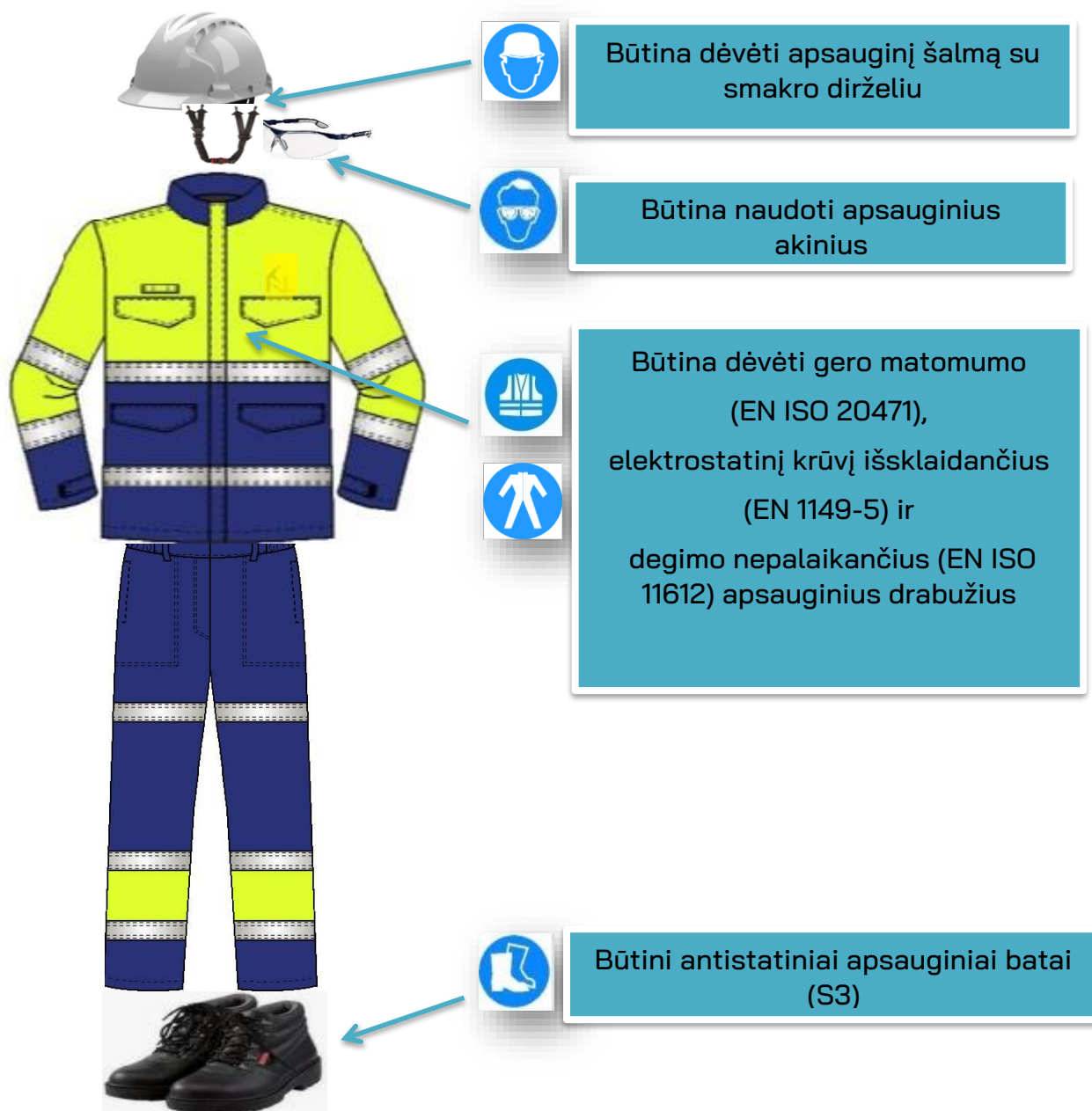
2 pav. Būtinios AAP, patenkančios į KN technologinius objektus ( įskaitant patekimą į potencialiai sprogia aplinką )

5.5. Rangovo darbuotojai, dirbantys KN objektuose, turi dėvėti darbo rūbus, pagal kuriuos būtų nesunku nustatyti, kokiam rangovui priklauso darbuotojas, t. y. ant darbo rūbų turėtų būti nurodytas rangovo pavadinimas ir/ar prekių/paslaugų ženklas. KN darbuotojams, rangovui, svečiui ar lankančiam statybvietyje ir KN objektuose, nepatenkančiam į technologinių įrenginių zonas ar potencialiai sprogia aplinką privaloma dėvėti AAP, nurodytas 1 pav.